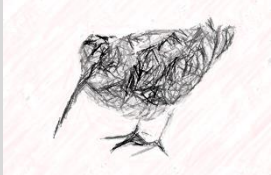
Bécasse des bois

aura encore des tirs par erreur. 98% de tous les canards restent chassables, alors qu'il n'y a aucune raison écologique à cette chasse.